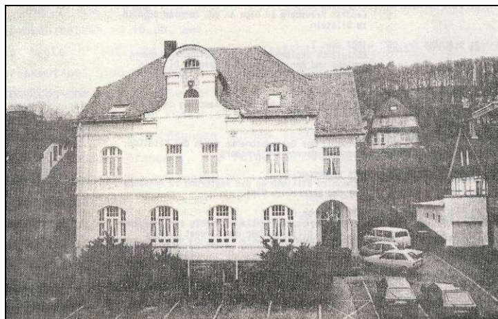
Das ehemalige Katasteramt, späterer Sitz der Amts- und Stadtverwaltung und heute Stadtarchiv, Kreisarchiv und zukünftiges Stadtmuseum nach der Renovierung der Außenfassade im Mai 1987

Im März 1984 stand das Gebäude an der Kölner Straße wieder leer. Nach Fertigstellung des neuen Rathauses in Altenhundem stand die Frage der weiteren Nutzung im Raum. Nachdem eine Verwaltungsnebenstelle, die mit einem Mitarbeiter der Stadtverwaltung dreimal in der Woche besetzt war, eingerichtet wurde, konnte nach umfangreichen Renovierungsarbeiten das Archiv der Stadt Lennestadt im 1. Obergeschoß Einzug halten. Im Erdgeschoß richtete die Kreisverwaltung Olpe ihr Kreisarchiv ein. In vier Räumen im 1. Obergeschoß und im Dachgeschoß wird der Heimat- und Verkehrsverein Grevenbrück in den nächsten Jahren ein Heimatmuseum einrichten.