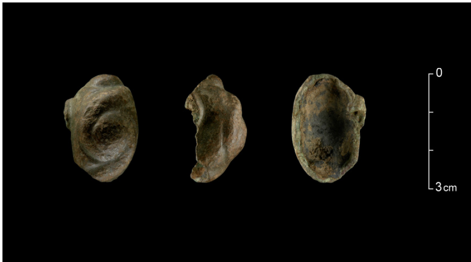
Bruchstück eines Hohlbuckelringes mit plastischer Verzierung in Spiralform auf dem Buckel, rund um den Buckel abgebrochen.