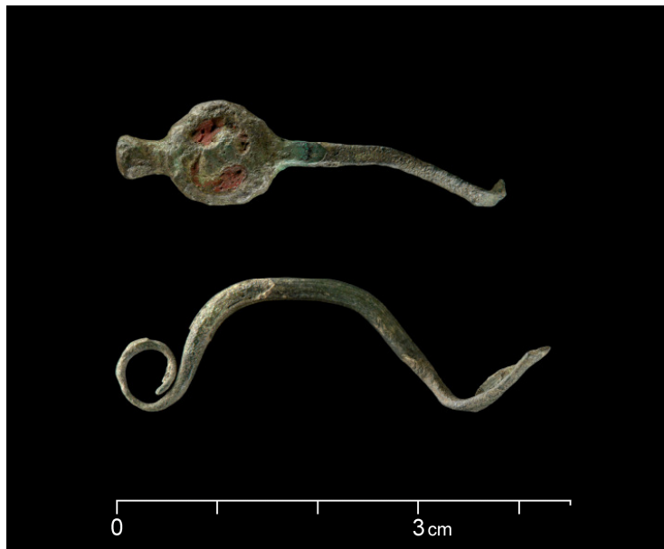
Zwei Fibelfragmente mit hohem Bügel, Fußscheibe mit mutmaßlicher Glaseinlage. Die Glaseinlage gibt zwei fischblasenförmige bzw. blütenförmige Ornamente wieder, die rotierend angeordnet sind.

Die Masse der Hohlbuckelringe stammt aus Gräbern des Ostlatèneraums, Einzelstücke sind aus Frankreich, Süddeutschland und nördlich davon bekannt. Aus Westfalen war bisher nur ein Exemplar aus der Rösenbecker Höhle bei Brilon bekannt. Dieses Fundstück ist selten in mittellatènezeitlichen Zusammenhängen.