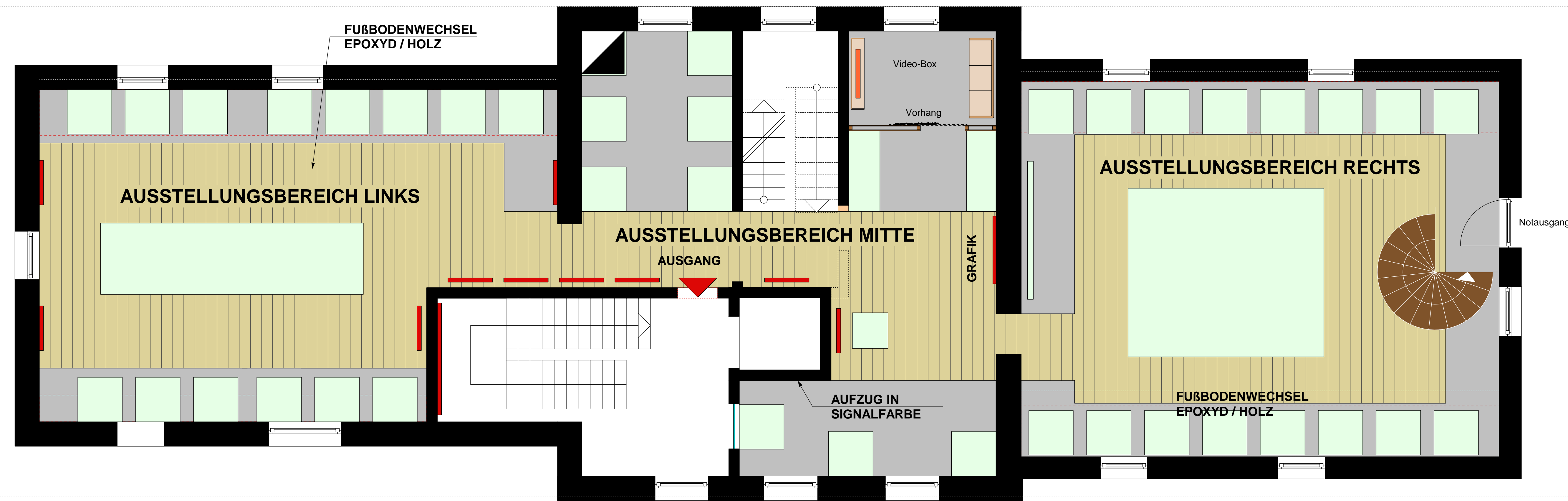
OG M 1:50